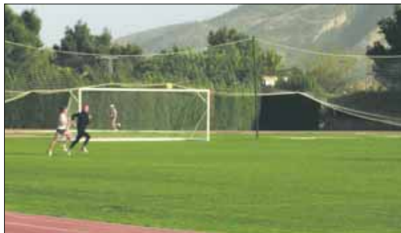
Alfaz's nyoppussede fotballbane er klar for å ta imot elitelagene fra Norge, Sverige, Island og Sveits.

Etter ett og et halvt års arbeide har Alfaz kommune kommet et langt stykke på vei i sin satsning på idrettsturisme. Hele 29 fotballag legger turen innom Alfaz denne våren. Elitelag fra Norge, Sverige, Island og Sveits skal spille mot spanske lag. Blant annet skal Ham Kam spille mot både Elche og Benidorm i marsmåned.