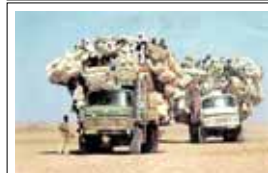
Et lite flyttelass