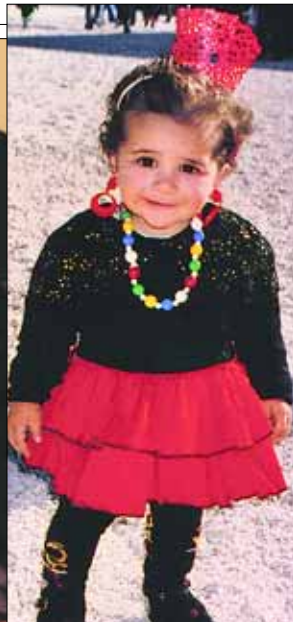
Flere små karnevalsgjester var flott utkledd.