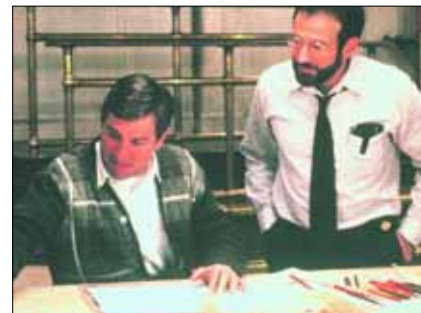
OPPVÅKNINGEN (AWAKENINGS) - Amerikansk drama fra 1990, med Robert De Niro, Robin Williams, Julie Kavner, Ruth Nelson, John Heard, og Penelope Ann Miller. Nattkino: Lørdag 24/3 kl 23.30.