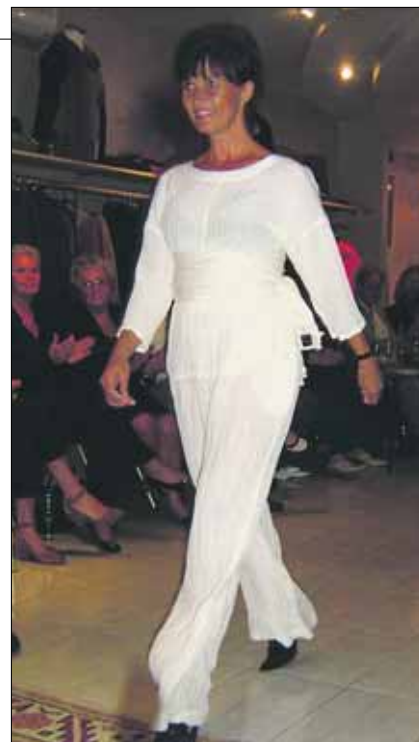
HØYRE: Unge jenter og voksne damer viser vårens mote