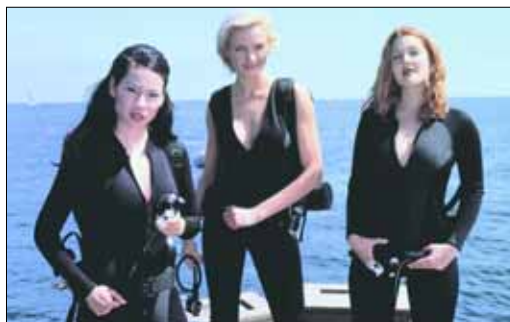
CHARLIE'S ANGELS - Amerikansk actionfilm fra 2000. Med Cameron Diaz, Drew Barrymore, Lucy Liu, Bill Murray, Sam Rockwell og Tim Curry. Søndag 18/3 kl 21.35