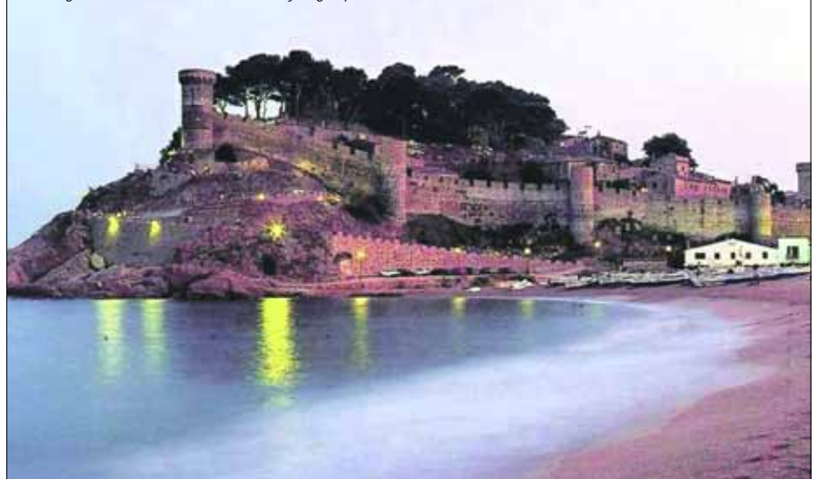
Festningen Tussa de Mar er et vakkert syn også på kveldstid.