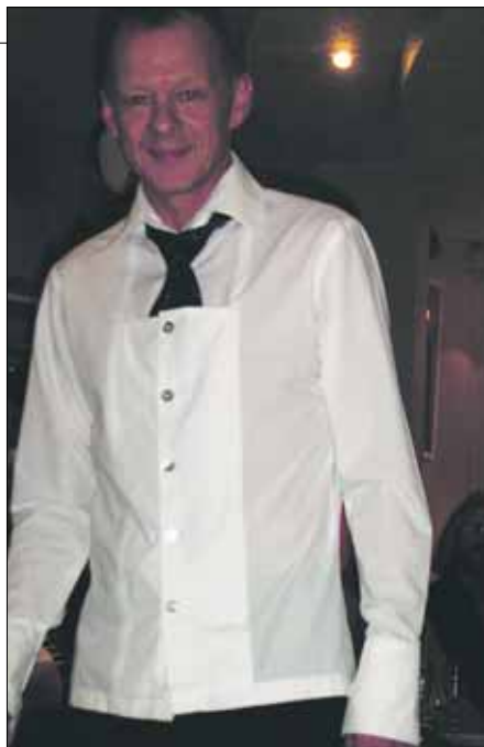
OVER: Det mannlige innslaget vekte oppsikt med spesielle skjorter med store knapper og "innvendig slips".