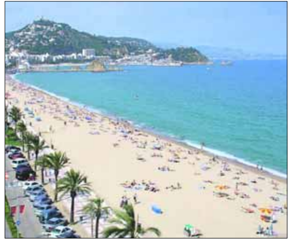
Hva med en lat dag på stranden Blanes?