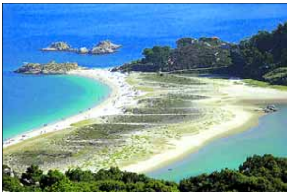
VERDENS BESTE STRAND: Cíes består av tre øyer og har vært en beskyttet naturpark siden 1980.

Verdens beste strand ligger verken i Kariben eller på en Middelhavsøy i Spania. Den ligger på Atlanterhav-siden av Spania, nærmere bestemt i Galicia i nordvest. Kåringen står den britiske avisen The Guardian bak.