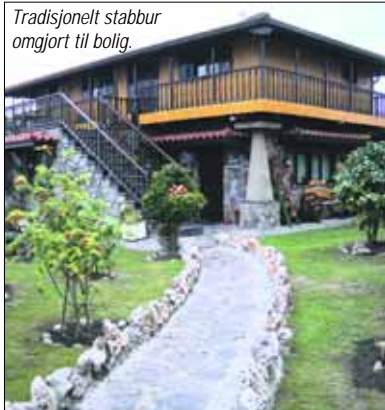
Tradisjonelt stabbur omgjort til bolig.

flere, deriblant "Utmerket Gastronomi" som favner om de beste restaurantene og cidreriaene i byen, samt "Kvalitetsbyhotell" som er hoteller som ligger i historiske bygg fra det attende og nittende århundret i blant annet byer som Oviedo og Aviles.