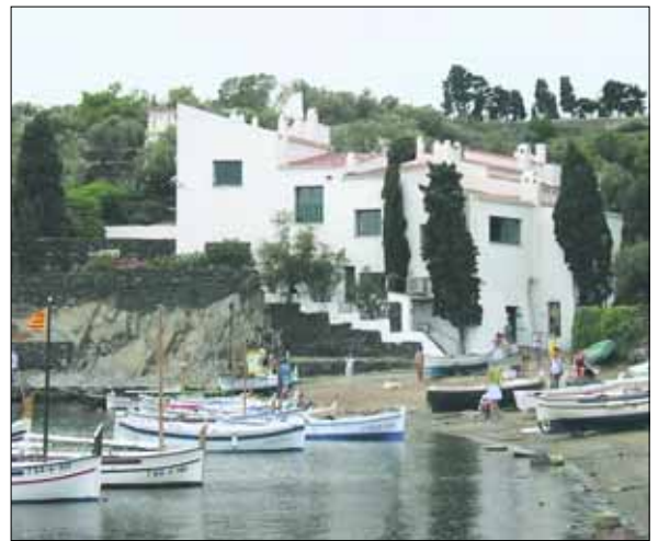
Salvador Dalí's hus i Port Lligat, ved byen Cadaqués.