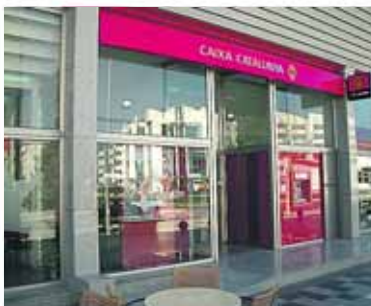
Vår filial i Albir

I de siste årene har Caixa Catalunya åpnet flere nye filialer i provinsene Alicante og Valencia som et ledd i sin ekspansjonsplan. Fokus med de nye filialene har vært å dekke de finansielle behovene til skandinaver og andre, fastboende såvel som ferierende.