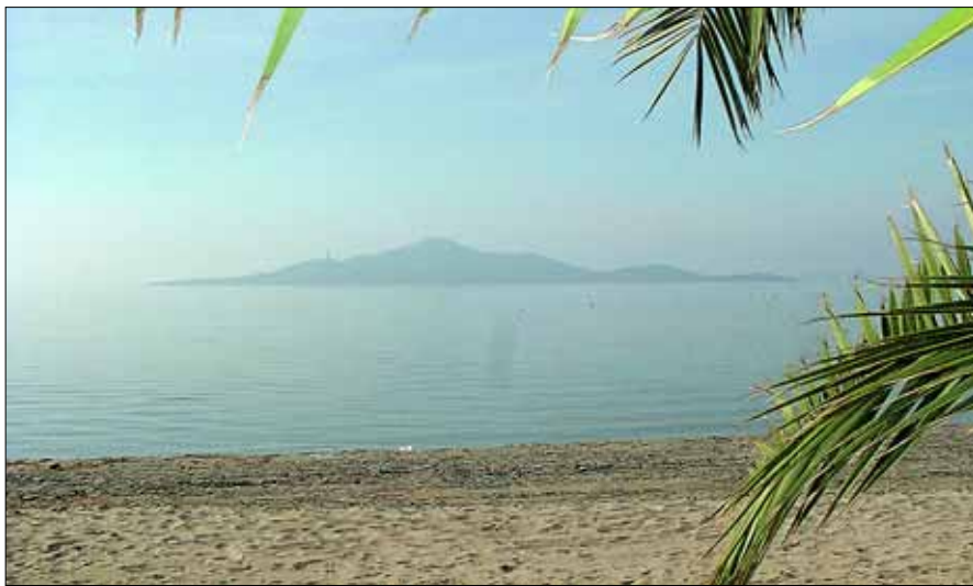
TIL SPANIA: Norges beste kvinnelige fotballspillere kommer hit til La Manga.

Mens flere av de norske lagene i Tippeligaen har gjort unna årets besøk på La Manga, tar 12 lag fra Toppserien turen til Spania i slutten av mars. Her følger oppsettet for treningskampene til Norges beste kvinnelige fotballspillere. Endringer kan forekomme, så sjekk www.kvinnefotball.no for sikkerhets skyld før kampstart.