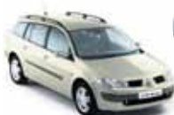
Renault Megane DCI