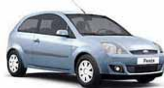
Ford Fiesta Trend