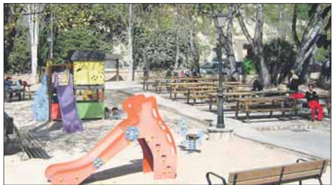
PICNIC OG LEK: Lek kan fint kombineres med picnic i parkens eget spiseområde.

Roxana. Roxana var selv uvitende om prestens bryllupsplaner og ble forferdet da en annen borger ved navn Aituna Ochoa fortalte henne om planene. Han lovet å befri henne fra giftemålet og selv gifte seg med henne. En dag da Aituna var ute på landeveien møtte han en gammel dame som kunne fortelle at Roxana var en utro kvinne. Da Roxana fikk høre de onde ryktene stakk hun av og gjemte seg i en grotte i byen. Presten kastet en forbannelse over henne. Jenta ble til stein og hennes øyne ble til to strie strømmer av tårer. Aituna var sorgtung og henga seg til månen i håp om å gjenforenes med Roxana. Månen forvandlet han til natteskinns "Lucero de la mañana". På natten speilet han seg i de strie vannstrømmene og på den måten omfavnet sin kjære Roxana.