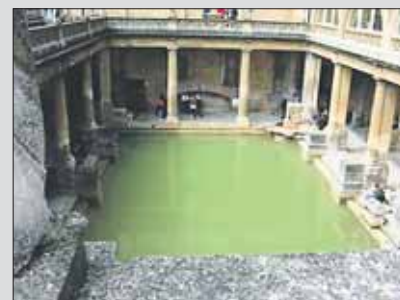
Tenk om man kunne benytte ruinene til å lage et bad i Romersk stil bygget på utgravningene?

Da er det ikke uten at vi må stoppe for å beundre de utgravningene som nå finner sted. Her avdekkes nemlig et fullstendig Romersk Badeanlegg datert til ca 100 etter Kristus. Man fornemmer det gode liv og fordums velstand, her har mennesker for ca to tusen år siden pleiet sin personlige hygiene ved siden av å nyte velvære og luksus et anlegg av store dimensjoner.