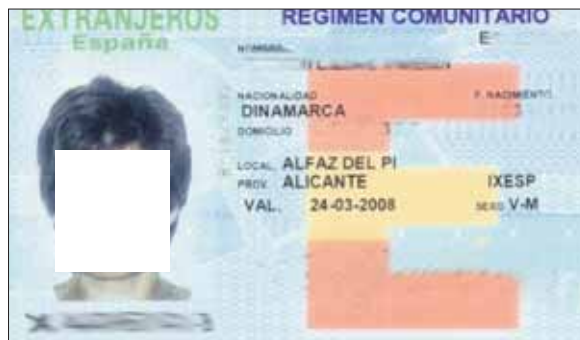
Kortet er sladdet pga personvern av innehaver.

er ut residensia hos det nasjonale politiet (Policía Nacional) eller ved det regionale utlendingskontoret. Selv om påbudet er opphørt anbefales folk å fortsette å bruke sine residensiakort som legitimasjon, eller ha med seg gyldig pass når man skal betale med kort eller skal henvende seg ved