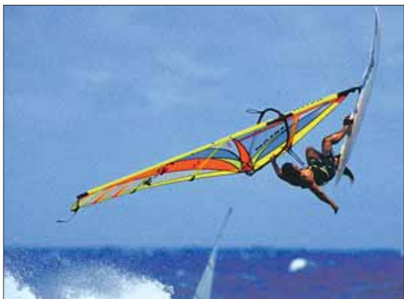
TOPPELITEN KOMMER: Windsurfing mesterskapet i Santa Pola går av stabelen i perioden 23. til 28 april.

W indsurf-klubben "El Club Windsurf Santa Pola" forbereder seg til Spanias aller første europeiske mesterskap i Windsurfing. Mesterskapet skal holdes i Santa Polas farvann i perioden 23. til 28. april, og regnes som det største maritime idrettsarrangementet den lille kystkommunen noen gang har arrangert.