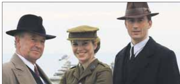
PÅSKEKRIM: KRIMINALSJEF FOYLE - Britisk krim, med Anthony Howell, Honeysuckle Weeks og Michael Kitchen. Søndag 8/4 kl 20.50.