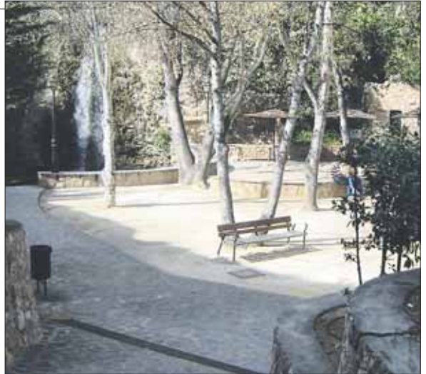
Godt tilrettelagt: Turstiene er mange og godt tilrettelagt for rullestol og barnevogn.

Man trenger ikke reise på landet for å finne landlige og idylliske omgivelser med fossefall og andedam. Rett nedenfor sentrum av La Nucía finnes en park med det ovenfor nevnte og mere til; turstier i mangfold samt leke- og turnapparater for henholdsvis de små og de spreke. En grotterestaurant kan også friste med noe å spise dersom en ikke har med medbrakt for en picnic under skyggefulle løvtrær.