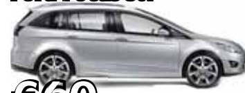
Ford Focus stv