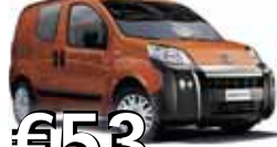
Fiat Florino TDI