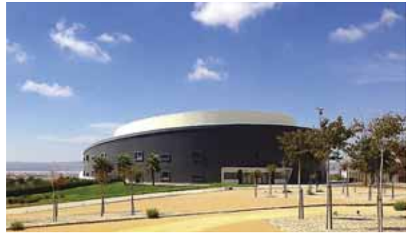
FULLSATT IGJEN?: Arrangørene forventer fullsatt sal når Beethovens niende symfoni skal spilles og oppføres i Torrevieja 2. mai.

Det lønner seg å kjøpe billett til konserten tidlig, for arrangørene regner med at det blir fullsatt 2. mai også, selv om Auditoriet i Torrevieja har nærmere 1 500 plasser.