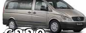
Mercedes Vito 9 seter