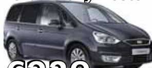
Ford Galaxy 7 seter