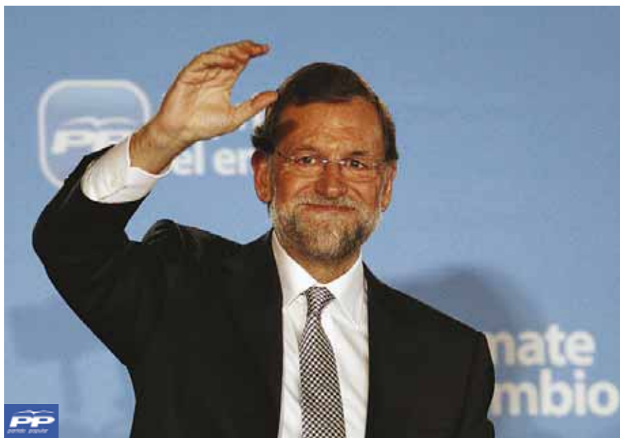
FORTSETTER: Den sittende statsminister Mariano Rajoy ønsker å fortsette som PPs toppkandidat og Rajoy vil gjerne bli sittende i statsministerstolen

Statsminister Mariano Rajoy har gitt beskjed om at han ønsker å være PPs statsministerkandidat ved neste valg og Rajoy lover at han skal gjøre alt som står i hans makt for at det konservative parti skal gjenvinne velgernes gunst.