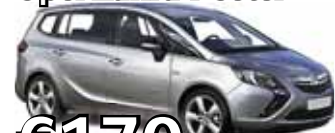
Opel Zafira 7 seter