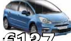
Citroen C4 Picasso