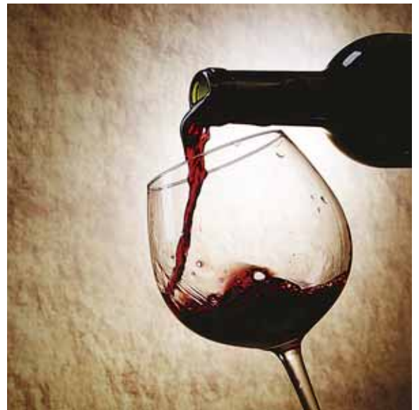
ØKNING: Norske menn og kvinner drikker nå mer alkohol enn for eksempel spanjolene. Omsetningen av vin øker for hvert år i Norge, mens den synker i Spania. Nå drikker Ola og Kari mer alkohol enn spanjolene.

SIRUS har registrert kun lovlig omsatt alkoholforbruk, så spriket mellom Norge og for eksempel Spania kan rent faktisk være enda større. Smuglersprit og til en vis grad hjemmebrenning er fortsatt populært i Norge. Disse tallene fanger ikke statistikken opp.