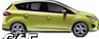
Ford Focus Cmax