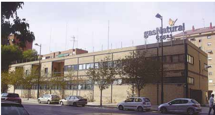
GASSANLEGG: Energiselskapet Gas Natural legger ny infrastruktur i Alfaz del Pi, som fører til at innbyggerne i kommunen nå får innlagt gass.

Det spanske energiselskapet Gas Natural har kommet til enighet med Alfaz del Pi om å få innlagt gass til kommunen.