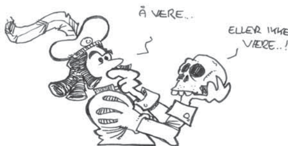
SER: Å være.