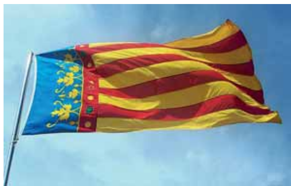
9 OKTOBER: Valencia regionen markerer sin nasjonaldag den dagen Jaime I innvaderte Valencia by og forkastet maurerne som hadde regjert her i over 500 år. Prosessen med "gjenkristningen" av Spania førte til forfulgelse av jøder og muslimer og prosessen vi i dag kjenner som inkvisisjonen.

Men fyrverkeri og parader i gatene er ikke det eneste som kjennetegner denne dagen, det er mer til historien. Den 9. oktober feires også Sant Dionís, som regnes for å være de forelskedes helgen.