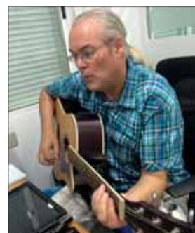
MYE SOSIALT: Her finpusses et av underholdningsbidragene.