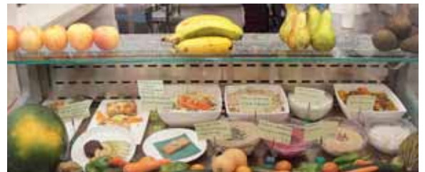
FRISKT: I disken med skilt på alle rettene er det lett å velge.

skulle være så gjennomført bærekraftig som mulig. Den viktigste investeringen i så måte er vannfilteret. Alt vannet som brukes er filteret, både det de vasker grønnsaker i, vasker hender i og det du drikker. Det brukes til og med til å spyle ned i toalettet, siden det er montert på hoved-