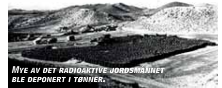
MYE AV DET RADIOAKTIVE JORDSMÅNNET BLE DEPONERT I TØNNER.

USA er blitt enige med Spania om å endelig rydde opp etter en flyulykke i 1966 der fire hydrogenbomber falt ned over Middelhavskysten ved Palomares (Almeria). Den snart 50 år gamle ulykken skjedde under "Den kalde krigen" da et bombefly og en drivstofftanker krasjet i luften under påfylling.