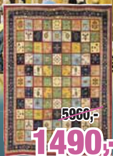
Ziegler, 300 cm x 200 cm