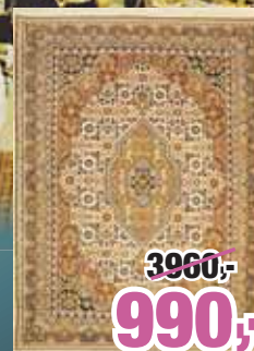
Bidjar, 300 cm x 200 cm