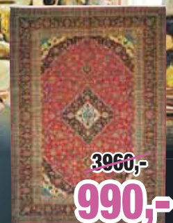
Keschan, 300 cm x 200 cm