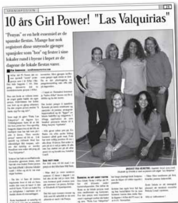
SPANIAPOSTEN 2003: Da SpaniaPosten for første gang besøkte "gjengen" for 12 år siden, feiret jentene 10-års jubileum.