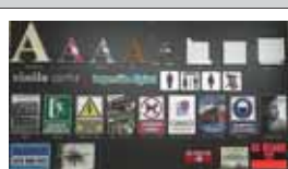
Logoer, utfreste bokstaver og mye mer