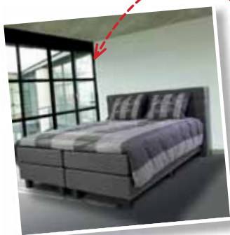
Kontinentalseng Stavanger 160 x 200 cm € 899,- 180 x 200 cm € 999,-

DEN BESTE KVALITETEN TIL DE LAVESTE PRISENE HOS HACO MUEBLES!