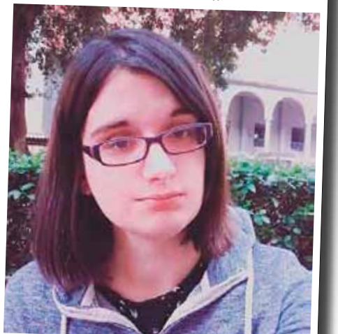
CASSANDRA: Studenten risikerer å miste retten til stipend som følge av loven i tillegg til muligheten til å måtte sone ett år

YTRINGSFRIHETEN ER TRUET I SPANIA: SpaniaPosten skrev i forrige utgave om den unge jenta som er dømt til et års fengsel for å ha vitset på twitter om attentatet på en av Francos ministre, Carrero Blanco. Saken er en av mange nå som for alvor setter spørsmålstegn med retningen Spania nå utvikler seg.